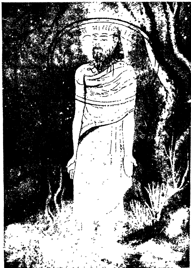
जैन योगीन्द्र श्री आनन्दघनजी